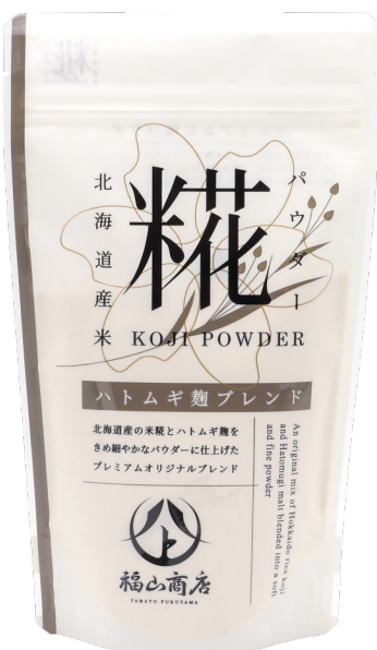
ヤマト福山商店 糀パウダー ハトムギ麴ブレンド 200g

福山醸造株式会社は、ヤマト福山商店ブランドの新商品として、自社の味噌蔵で仕込んだ「ハトムギ麴」を使用した2商品を発売いたします。