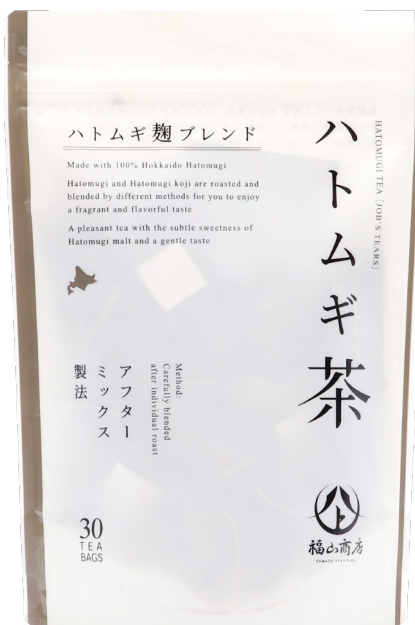
ヤマト福山商店 ハトムギ茶 ハトムギ麴ブレンド 3g×30包入

北海道産の米糀とハトムギ麴をきめ細やかなパウダーに。 プレミアムオリジナルブレンド