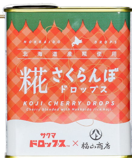
ヤマト福山商店 糀さくらんぼドロップス 71g